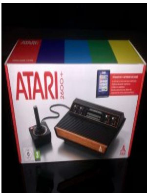
Der neue Atari 2600+

Also ein großes Plus für den neuen Atari 2600+. Seine Farben erstrahlen in nie gesehener Pracht und plötzlich fühlt sich ein uraltes Atarispiel wie Highteck an.