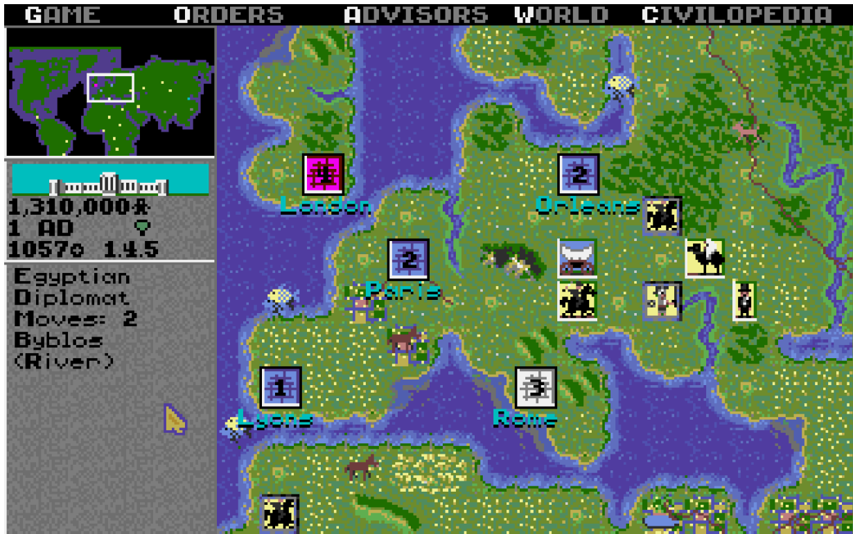
Europa füllt sich.

So großartig, dass ich heute wieder zu diesem allerersten Teil aus dem Jahre 1991 zurückkehre und die Nation von Hardystan von ihren bescheidenen Anfängen in grauer Vorzeit bis zu ihrem glorreichen Triumph über Napoleon, Caesar und den alten Kriegstreiber Gandhi führe.