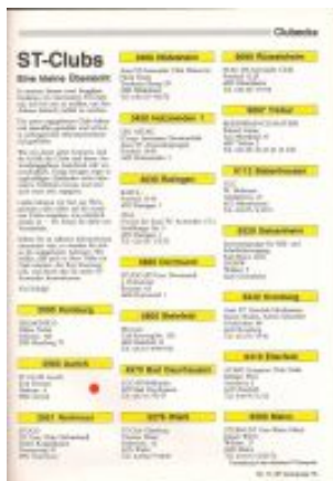
Übersicht der ST-Clubs aus der ST-Computer, Ausgabe November 1986.