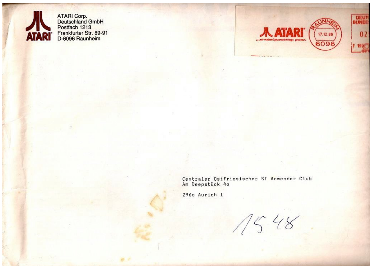
Infopost von Atari an unseren Club vom 17. Dezember 1986.

Aber der Club war gegründet, es gab einen Schriftführer, Kassenwart und den ersten und zweiten Vorsitzenden. Auch ein Konto wurde bei der Volksbank eingerichtet und ich besorgte bei der Post ein Postfach, E-Mail gab es noch nicht.