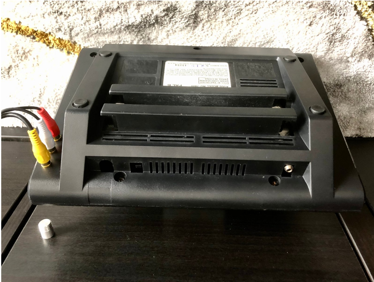
Die gemoddete Konsole.

Noch ein Tipp! Versucht euch vielleicht erst einmal an den Top 10 meiner Lieblingsgames und ob hier Gamer und Konsole auch wirklich zusammenpassen. Natürlich am besten mit einem Seagull Adapter und einem guten Mega Drive Controller oder zumindest einem Atari 2600/VCS Joystick.