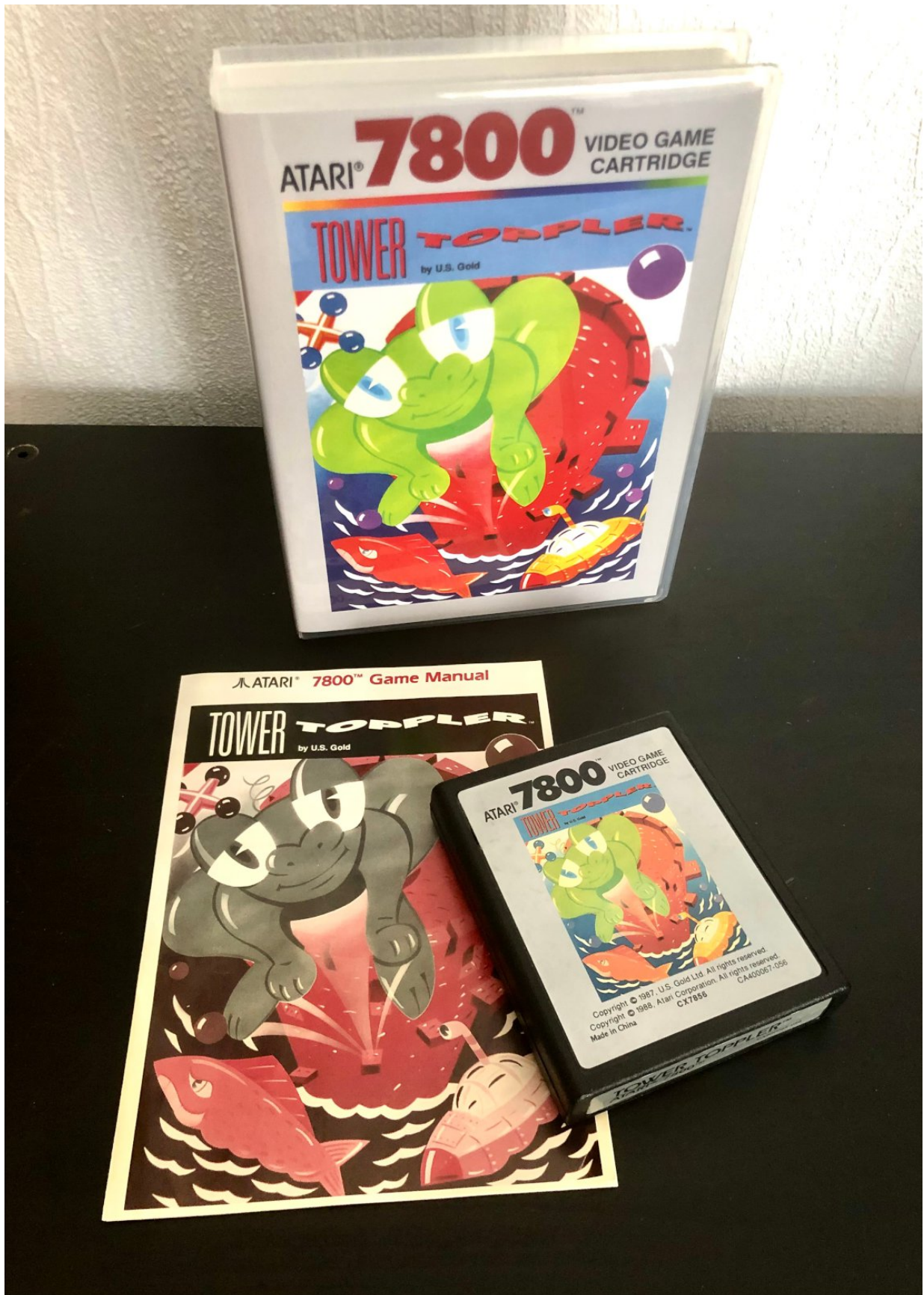
Der verfluchte Toppler.