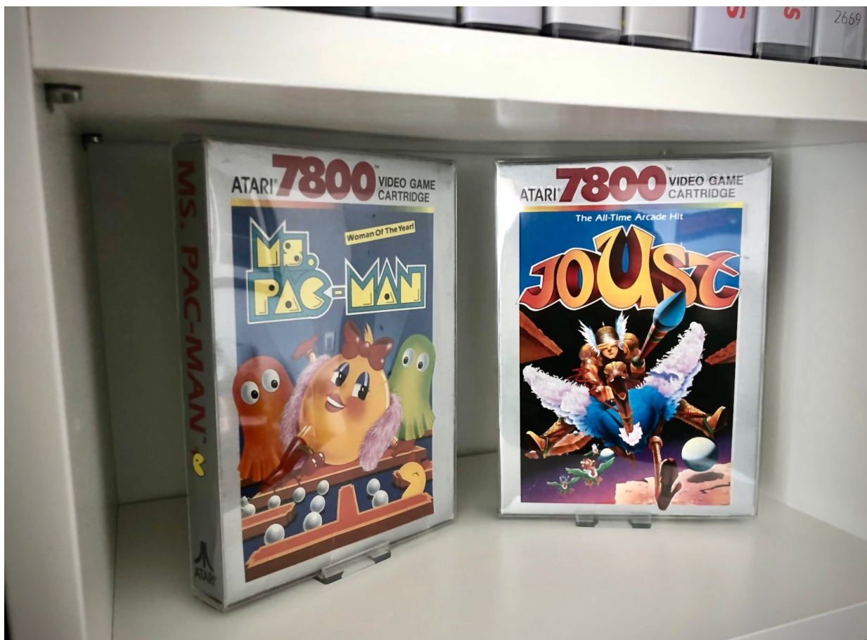
Ms. Pac-Man und Joust für das Atari 7800.

Versionen erfolgreicher Arcadeautomaten, ordentlich aber nicht perfekt umgesetzt. Nur noch für den eingefleischten Retro- und Atarifan, aber wichtiger Bestandteil einer gepflegten 7800er Sammlung.