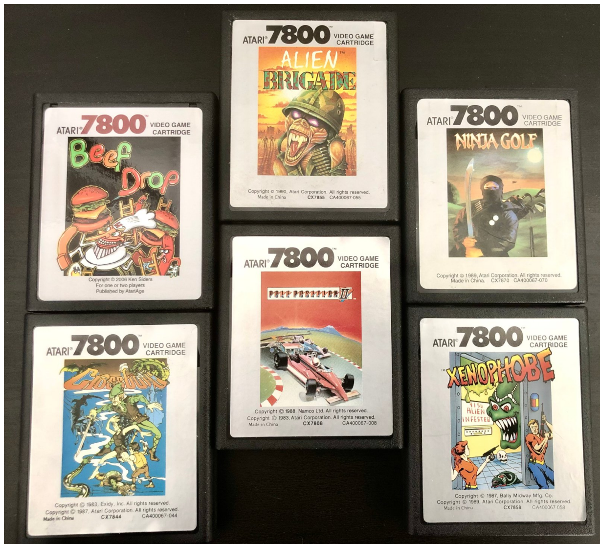
Lieblingsspiele. (Bild: Paul Hartmann)