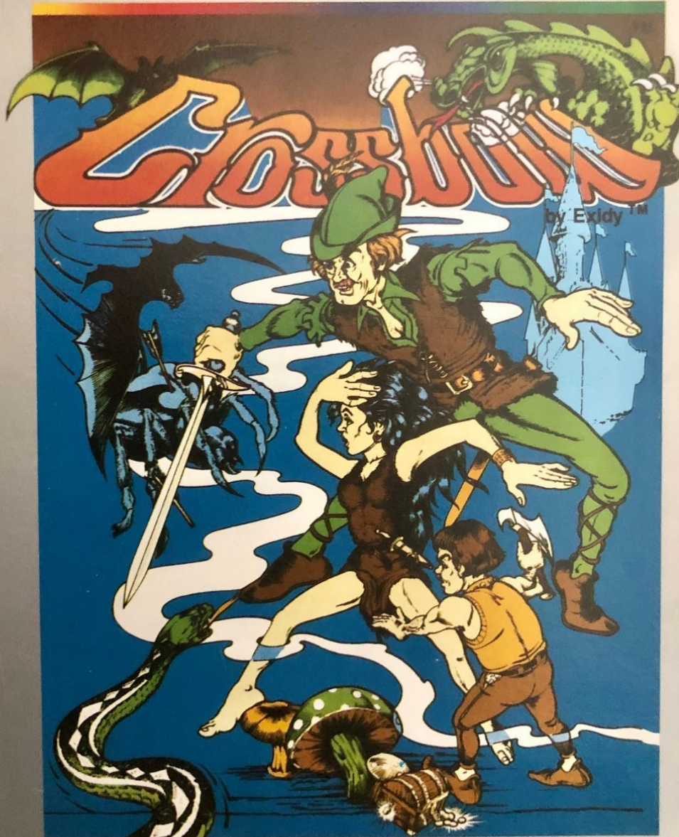
Crossbow für das Atari 7800.