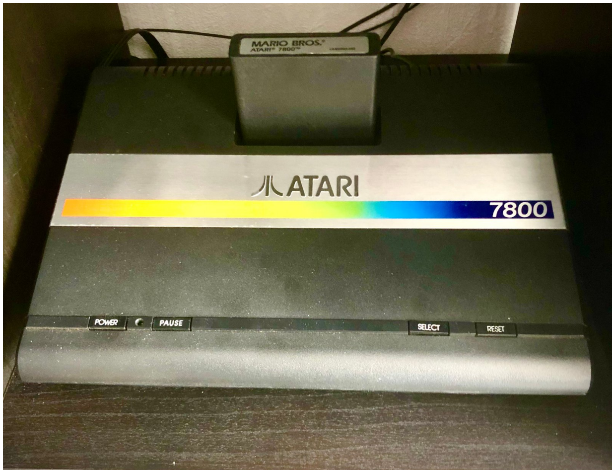
Der Atari 7800.