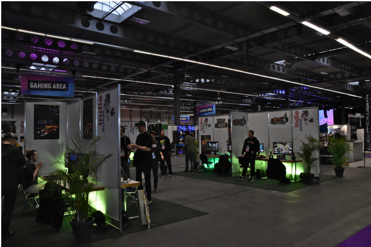
Ein Teil der Indie-Stände der Halle 2.

Auf der Messe hatte ich die Möglichkeit genutzt, mir vier Indie-Titel etwas genauer anzusehen.