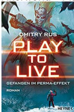
Play to Live, Dmitry Rus

Dieses Buch zu lesen war eine echte Überraschung für mich. Plötzlich wurden mir da mitten im Roman Characterscreens, Level-Up-Popups und die Werte irgendwelcher Gegenstände „eingblendet“. Ohne vorher viel darüber gehört zu haben, war ich zufällig über ein Sub Genre der GameLit gestolpert: Das LitRPG.