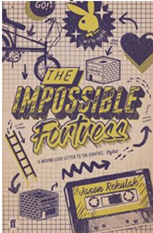
The Impossible Fortress, Jason Rekulak

Billy Marvins Wunderjahre , wie das Buch in der deutschen Übersetzung heißt, würde ich als herzerwärmende Coming-of-Age-Story bezeichnen, die an die Höhen und Tiefen der eigenen Pubertät erinnert.