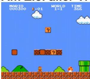
Super Mario Bros. von 1985 auf dem NES.