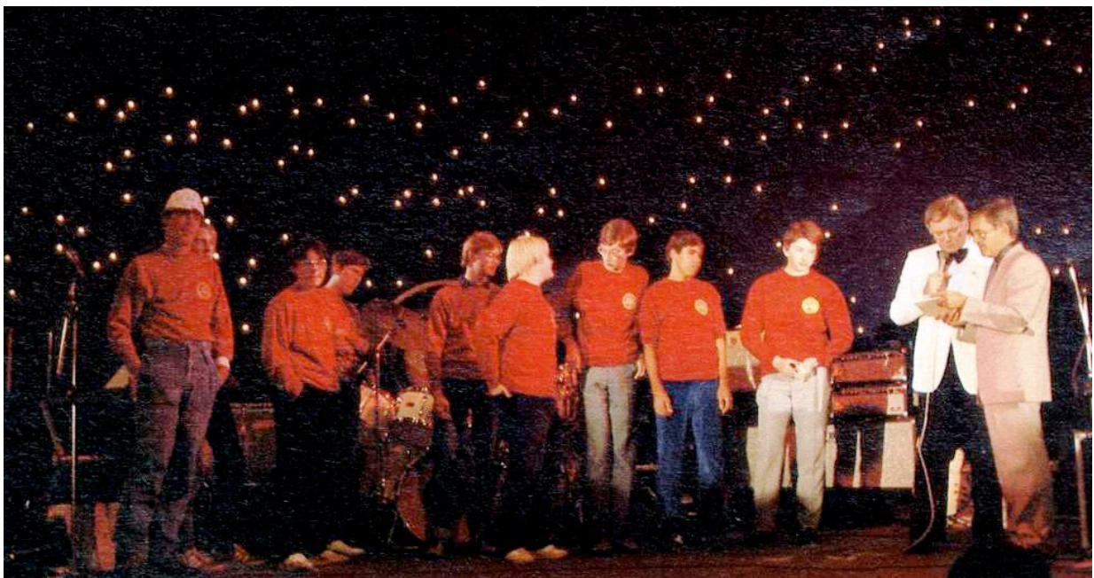
Junge Videospieler unter dem Sternenhimmel. Impression von der Weltmeisterschaft von 1983.

Dort kam ich als letzter an, wegen schlechter Zugverbindungen, habe mitgespielt und knapp gewonnen. Daraufhin sollte ich zur Weltmeisterschaft nach Monaco. Jedoch eine halbe Woche vor dem Start der Weltmeisterschaft starb dann Gracia Patricia von Monaco und die Regierung setzte eine Woche Staatstrauer an. Atari verlegte nun die Weltmeisterschaft innerhalb von zwei Tagen nach Paris. Dort habe ich gegen insgesamt 15 Nationen gespielt und den vierten Platz belegt.