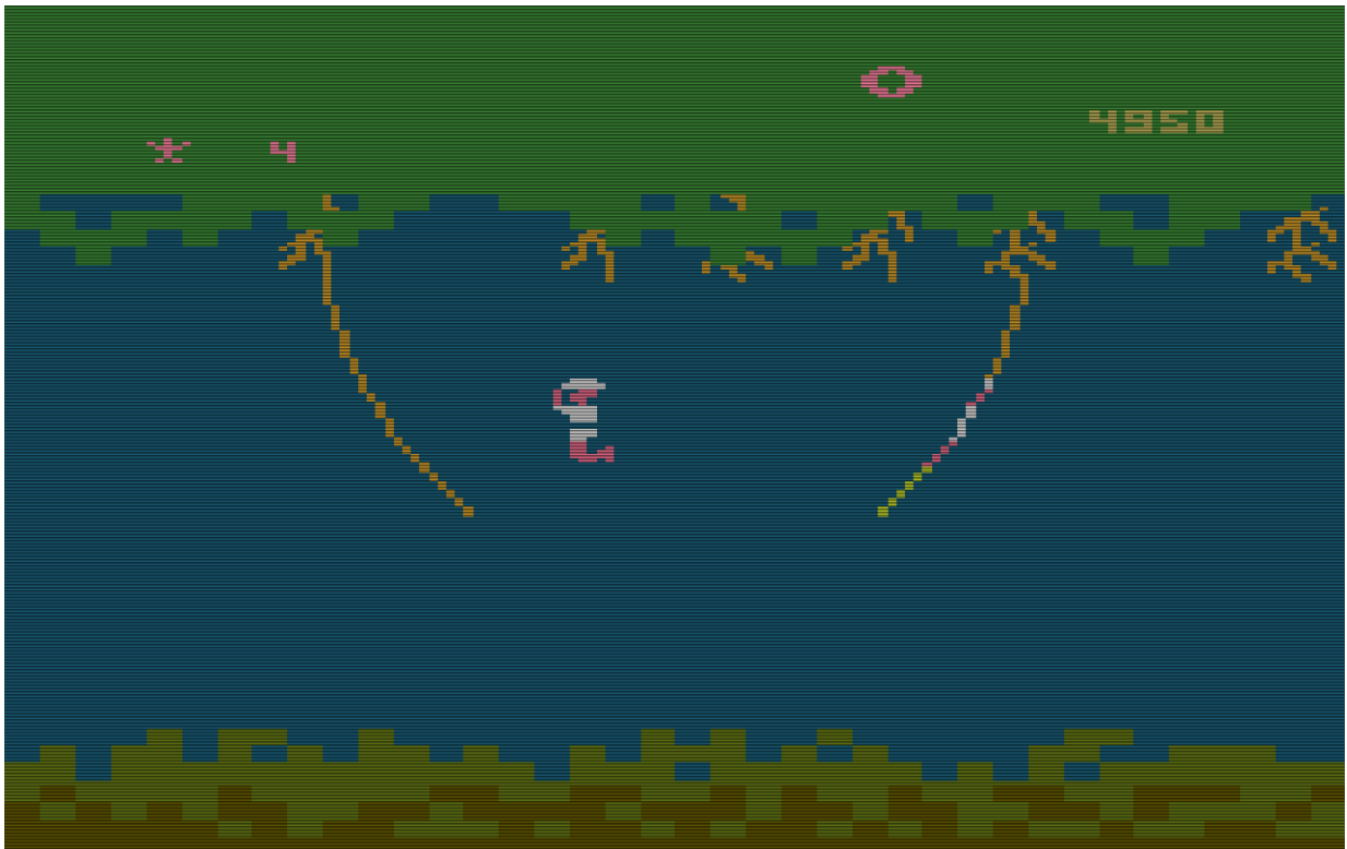
Level 1 von Jungle Hunt für das VCS.

Im ersten Level muss sich unser Held von Seil zu Seil schwingen, ohne in den tödlichen Sumpf zu fallen. Da die Sprungweite begrenzt ist, muss der richtige Zeitpunkt gefunden werden, um mit dem Feuerknopf von einem schwingenden Seil auf das nächste zu springen. Allerdings springt Sir Dudly Dashly so kraftvoll von den Seilen ab, dass man glauben könnte, er hätte die Gesetze der Schwerkraft außer Kraft gesetzt.