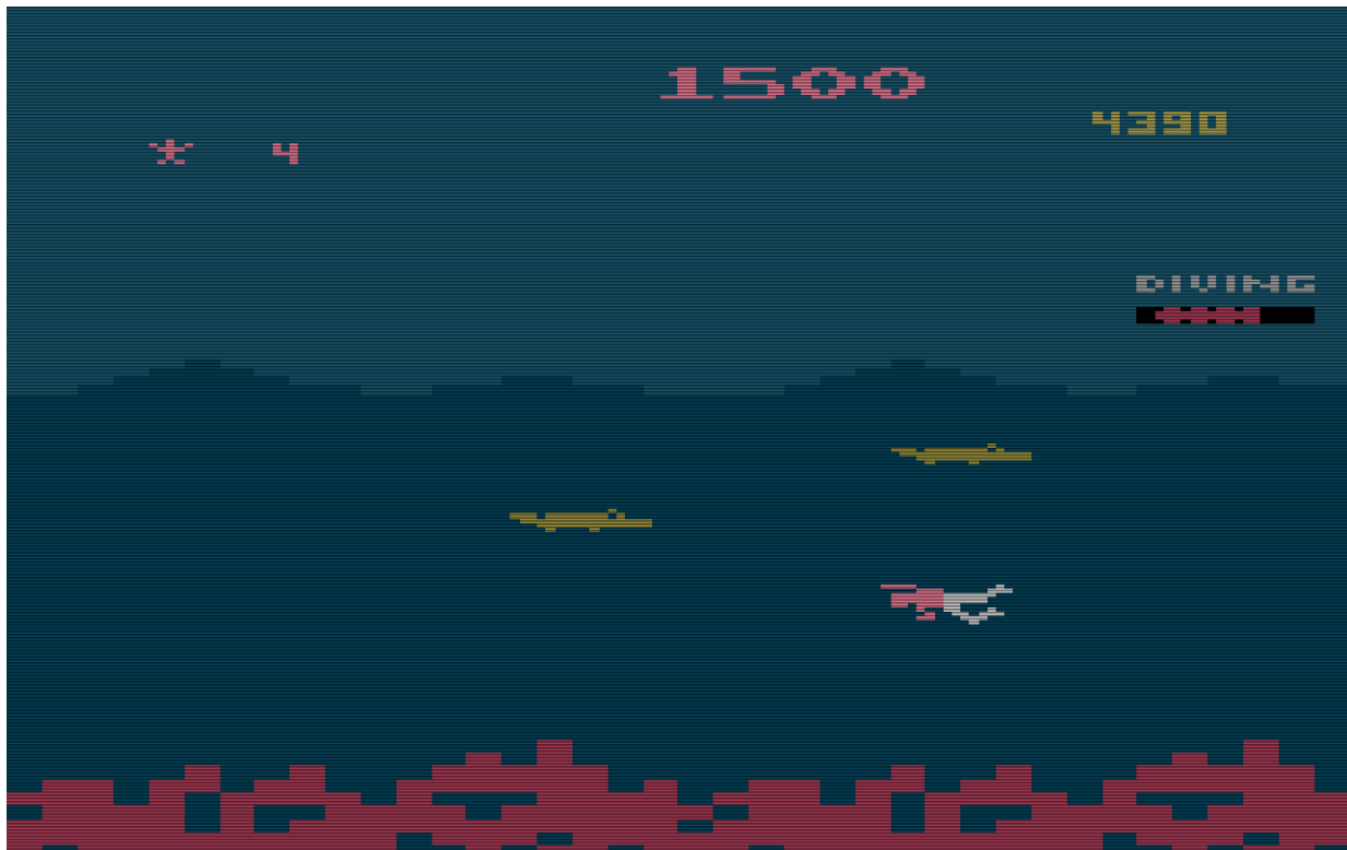
Level 2 von Jungle Hunt für das VCS. (Bild: Atari)