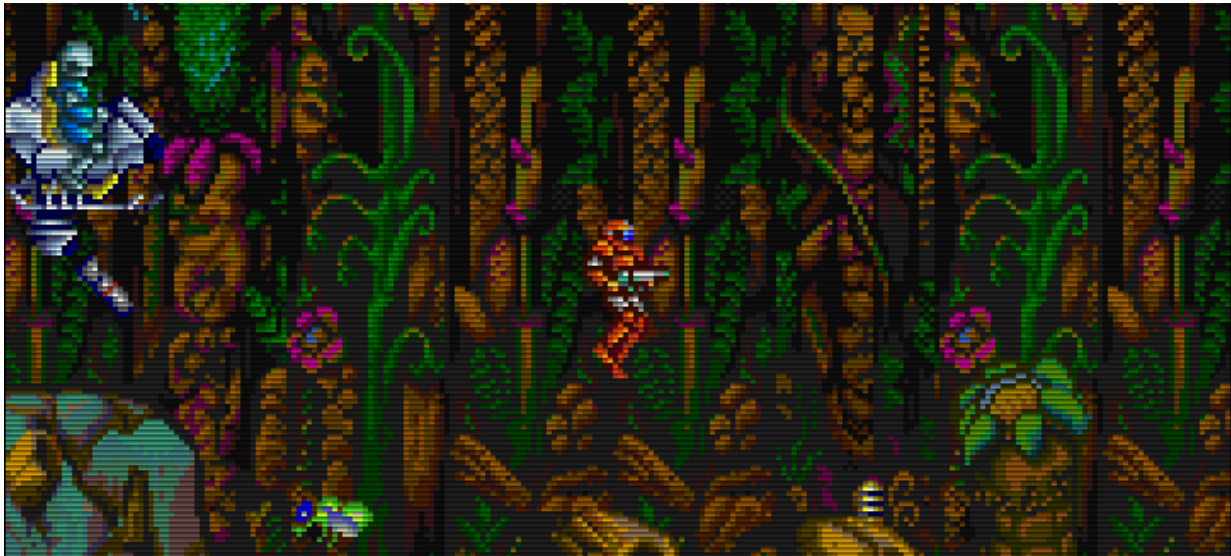
Unterwegs in den grünen Wäldern von Xain'd Sleena.

heimischen Flora und Fauna um mich herum, noch meinem Microcomputer, der in meinem kleinen Zimmer zuhause auf mich wartet. Ich denke an etwas anderes, etwas, wie es mir schien, größeres.