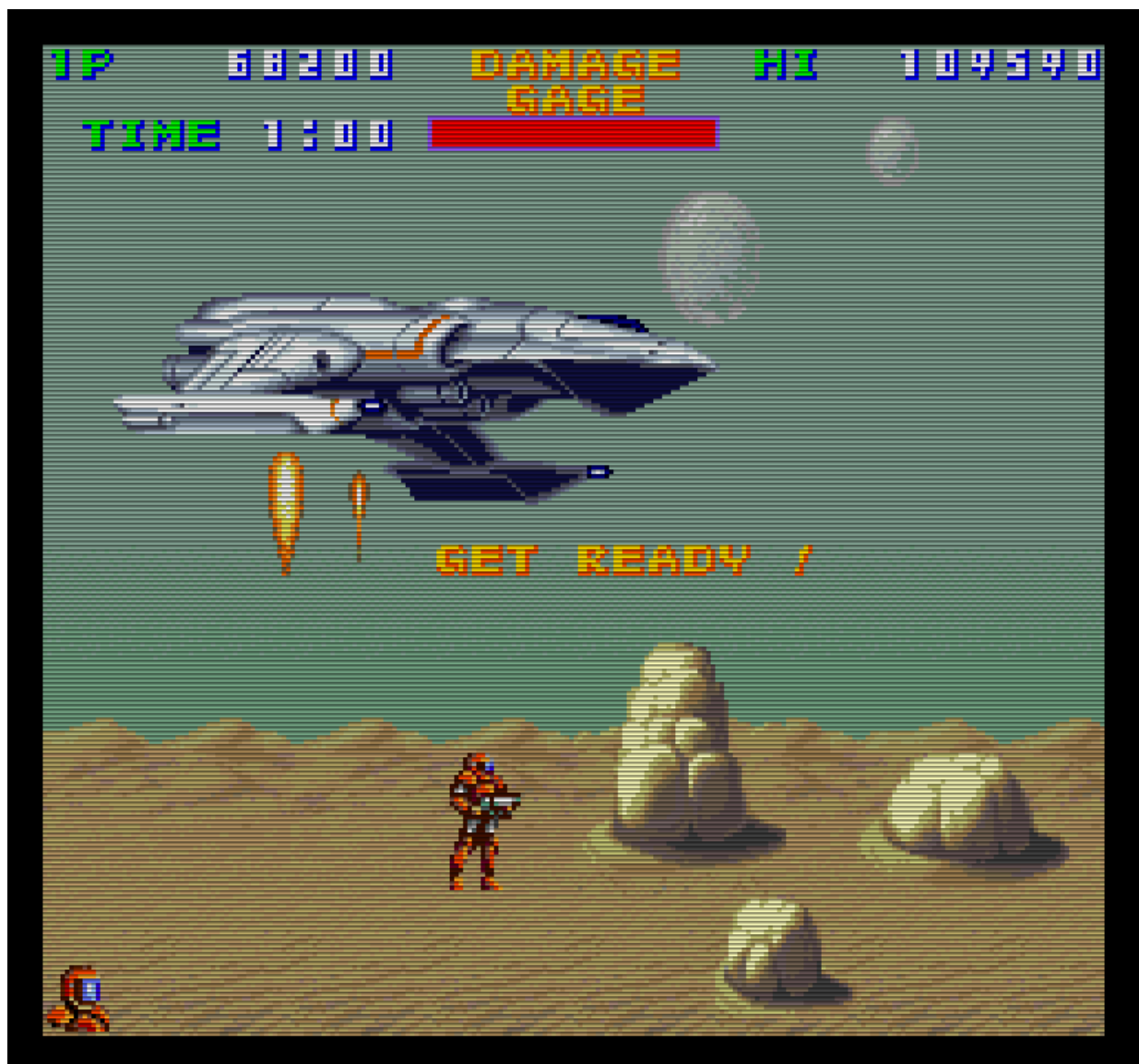
Im Sandmeer des lebensfeindlichen Wüstenplaneten Cleedos Soa.

Auf der Kirmes im Nachbardorf sah ich die Maschine wieder. Sie war umringt von Kindern und Jugendlichen, die ebenso fasziniert wie ich waren von diesem Wunder von einem Spiel. Und ebenso wie ich scheiterten sie trotz ihrer fast grenzenlosen Ambition allesamt an der gestellten Aufgabe. Schaffte es einer den ersten Planeten unter Aufbietung seines ganzen Geschicks und Könnens zu meistern, überstand er die Gefahren des Weltraums und den einsamen Kampf eines kleinen Abfangjägers gegen die imperiale Flotte, so scheiterte er dennoch im Sandmeer des Wüstenplaneten oder im dichten Grün des Dschungelplaneten an seiner Aufgabe.