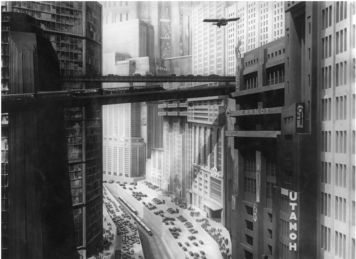
Architektur in Metropolis.

Zugegeben, dieses Jahrhundert hat es wirklich in sich. Was haben die Menschen nicht alles entwickelt?! Martin Luther hat vor 500 Jahren die Reformation eingeleitet und wäre Kaiser Sigismund nicht vor Scham errötet, wäre das wohl alles so nicht gekommen. Jede Zeit hat ihre wichtigen Dinge. Das Internet ist wie damals der Buchdruck (ohne den die Reformation auch nicht ... aber lassen wir das ...) ebenso eine Revolution. Und die Homecomputer sind es für uns auch. Ohne diese Computer würden wir jetzt nicht diesen Blog lesen. Und ohne Computer und die Beschäftigung mit selbigen würden wir uns das digitale Leben und die digitale Kompetenz komplett absprechen. Wir hätten einfach keine Ahnung davon (was ja nicht so schlimm wäre, denn andere wären dann die NERDs und hätten uns dann sicher helfen können – und wie wir wissen, sind das ja tolle Menschen).