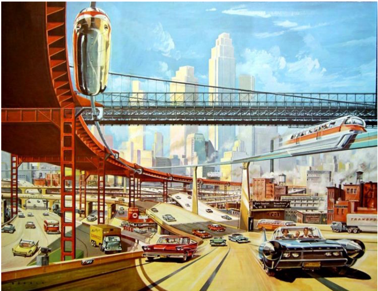
Technologie und Verkehr im Futurismus.

Ich stelle oft fest, das Freunde in meinen Hobbykeller kommen und sagen "Oh, toll, den C64 hatte ich auch mal – mein Lieblingsspiel war damals Bruce Lee". Und wenn ich dann Bruce Lee starte und wir zusammen spielen, erschöpft sich das nach kurzer Zeit und der Kumpel verliert das Interesse. Nicht weil er das Spiel nicht mehr mag, sondern weil er feststellt, das er nicht mehr der selbe Mensch von früher ist. Aber er wird vielleicht doch ein Sehnsuchtsgefühl bekommen und sich dann einen alten C64 kaufen und ab uns zu damit spielen?! Vielleicht ... Und so ist es an uns, diese Zeit zu erhalten.