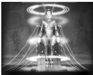
Maria aus Metropolis.

Zugegeben, dieses Jahrhundert hat es wirklich in sich. Was haben die Menschen nicht alles entwickelt?! Martin Luther hat vor 500 Jahren die Reformation eingeleitet und wäre Kaiser Sigismund nicht vor Scham errötet, wäre das wohl alles so nicht gekommen. Jede Zeit hat ihre wichtigen Dinge. Das Internet ist wie damals der Buchdruck (ohne den die Reformation auch nicht ... aber lassen wir das ...) ebenso eine Revolution. Und die Homecomputer sind es für uns auch. Ohne diese Computer würden wir jetzt nicht diesen Blog lesen. Und ohne Computer und die Beschäftigung mit selbigen würden wir uns das digitale Leben und die digitale Kompetenz komplett absprechen. Wir hätten einfach keine Ahnung davon (was ja nicht so schlimm wäre, denn andere wären dann die NERDs und hätten uns dann sicher helfen können – und wie wir wissen, sind das ja tolle Menschen).