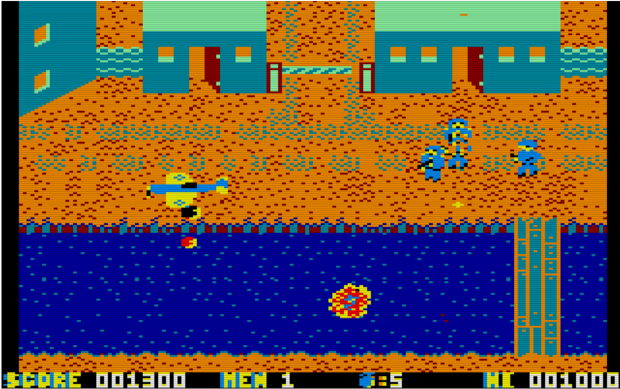
Dafür übertrieb des die Amstrad Version von Who Dares Wins 2 manchmal mit der Farbauswahl. (Bild: Alligata)

Das Spiel bringt es auf etwas mehr als eine Hand voll Spielstufen, wobei die letzten nicht mehr die große Zahl von Bildschirmen erreichen wie die ersten, dafür aber mit einer Vielzahl von Gegnern mehr aufwarten. Zwischendurch sollte man immer mal auf Geiseln achten, die vor einem Erschießungskommando stehen. Wenn man diese schützt (durch das Ausschalten des Scharfschützen) gibt es wiederum Bonuspunkte. Das Spiel endet wie so viele Spiele der damaligen Zeit in einer Endlosschleife was bedeutet, dass man nach dem letzten Außenposten die Mitteilung bekommt, dass man leider wieder von vorne beginnen müsse, da das nachrückende Team es nicht geschafft habe, die Außenposten zu verteidigen. Man fängt also wieder ganz am Anfang an und kann seine Jagd nach dem Highscore fortsetzen.